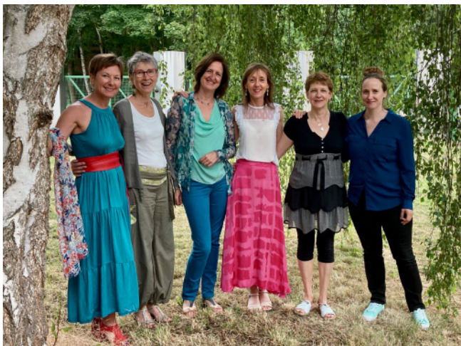
Par ordre alphabétique de droite à gauche